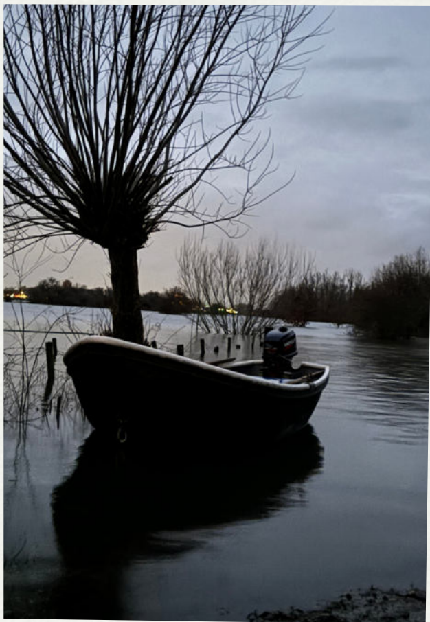
Bootje naar Korenmolen De Hoop